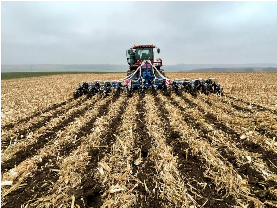
Souprava pásového traktoru se středovým systémem řízení a nový Ferti Tiller 900

Na pozemku po sklizni kukuřice na zrno pracovala souprava velice kvalitně i ve velkém množství posklizňových zbytků.