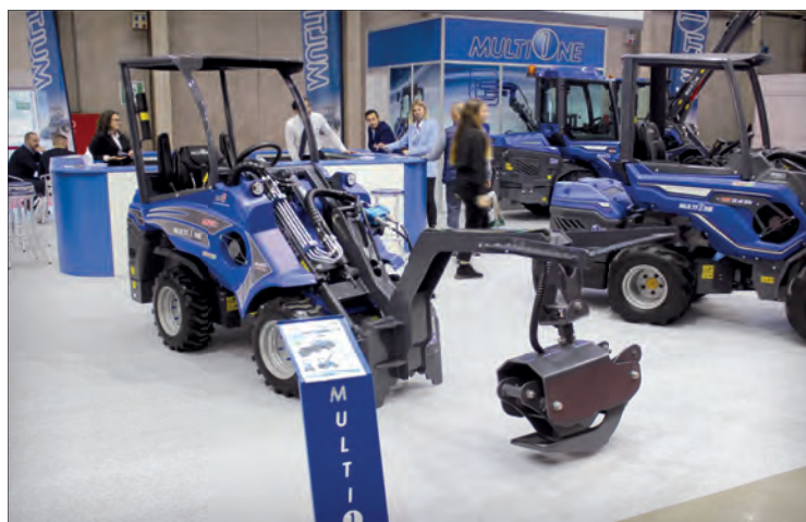
Drapak se vhodně využije při manipulaci s kulatinou, ale i s větvemi. Paralelogram ve standardní výbavě všech nakladačů řady 5 umožňuje hladkou manipulaci se sypkými materiály či s paletami

K nakladači lze také připojit a ihned začít využívat všechny druhy příslušenství MultiONE s elektrickým a hydraulickým ovládním. Díky systému ACI není zapotřebí k nakladači instalovat žádné další prvky či kabeláž. MultiONE 5.3k tak představuje ideální vstupní model do oblasti profesionálních kompaktních kolových nakladačů. A to i díky velkému výkonu svého hydraulického systému.