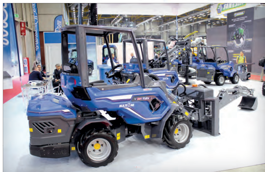
Na okraji stánku stál nakladač MultiONE M1 7.2k v agregaci s podkopem stejné značky. Funkce podkopu lze ovládat buď z kabiny nakladače, nebo z namontované sedačky či také dálkově