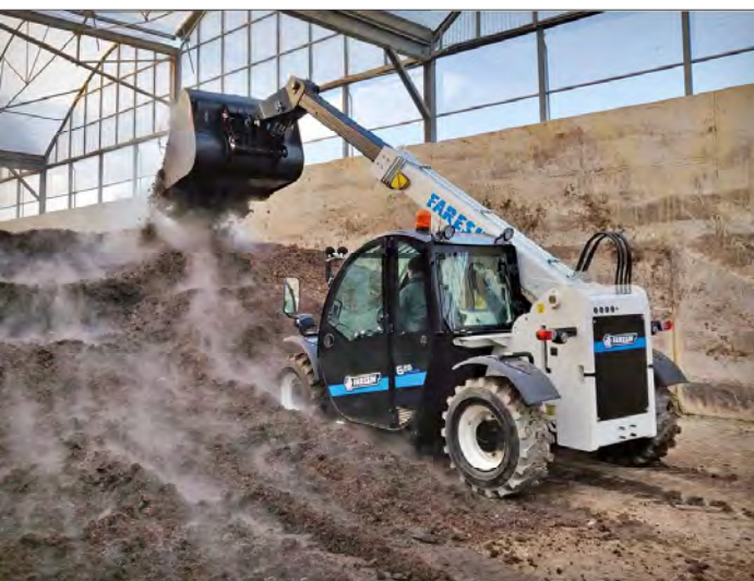
Kompaktní model Faresin Full Electric 6.26 dosahuje na svém rameni maximální nosnosti 2600 kilogramů

Výhradní importér, společnost P & L, se může pochlubit tím, že první stroj má již svého majitele. Tento stroj byl představen na Výstavních dnech ve Velkém Meziříčí jako novinka pro rok 2023. Další objednávky na sebe nenechaly dlouho čekat, a tak v následujících měsících budou na farmách zákazníků společnosti tyto tiché, pohodlné a úsporné stroje k vidění stále častěji.