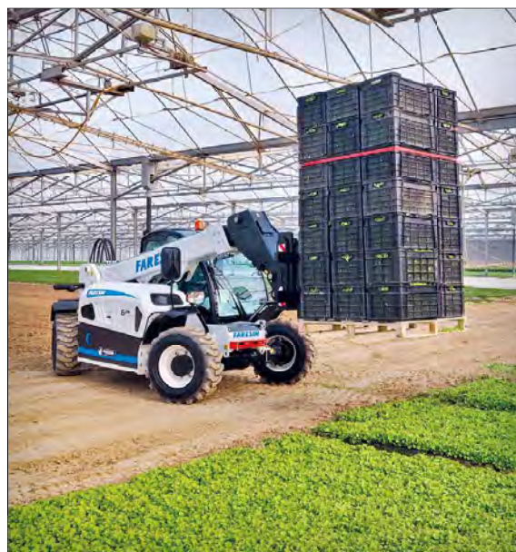
Teleskopické manipulátory Faresin Full Electric mohou být využívány v uzavřených prostředích, k nimž patří například i skleníky, protože jsou lokálně zcela bezemisní

Ústřední součástí je lithium-iontový akumulátor s kapacitou 45 kWh, který pracuje s vysokým napětím 435 V a který napájí dva elektrické motory, z nichž je-