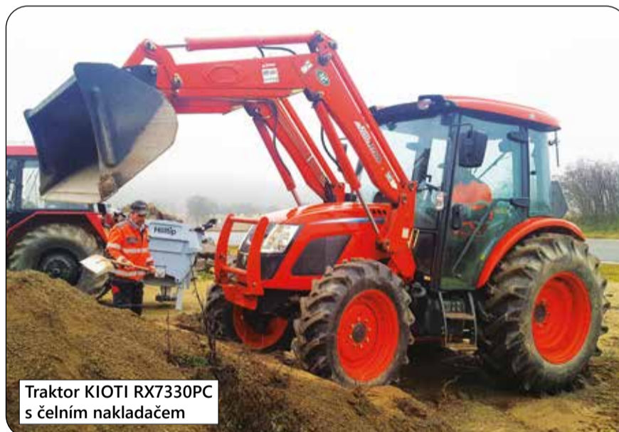
Traktor KIOTI RX7330PC s čelním nakladačem