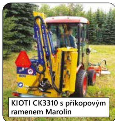
KIOTI CK3310 s příkopovým ramenem Marolin