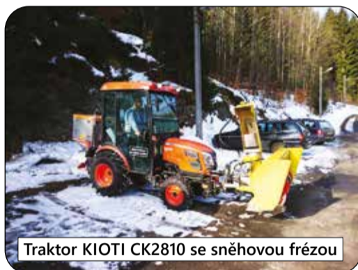
Traktor KIOTI CK2810 se sněhovou frézou