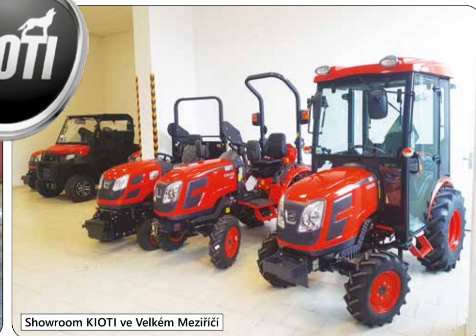
Showroom KIOTI ve Velkém Meziříčí