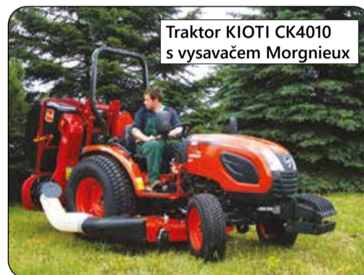
Traktor KIOTI CK4010 s vysavačem Mornieux