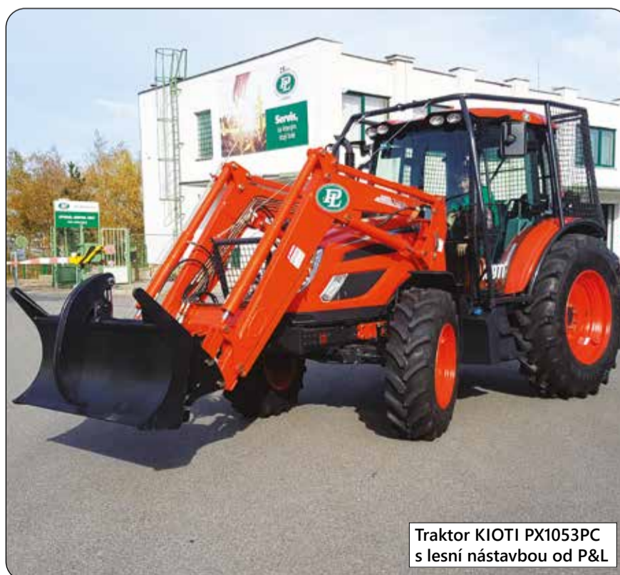
Traktor KIOTI PX1053PC s lesní nástavbou od P&L