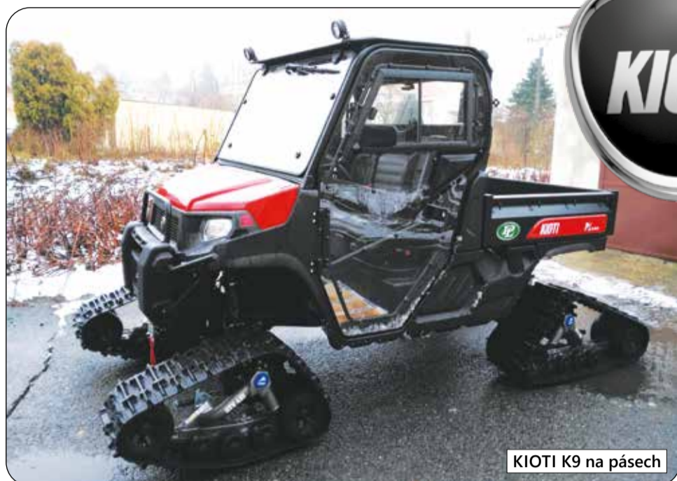
KIOTI K9 na pásech