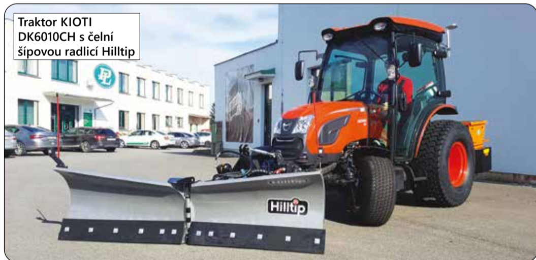
Traktor KIOTI DK6010CH s čelní šípovou radlicí Hilltip