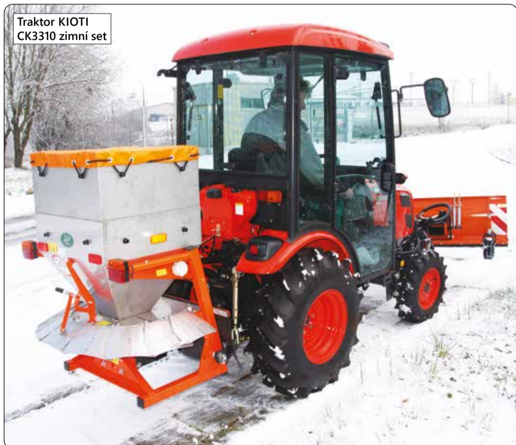
Traktor KIOTI CK3310 zimní set