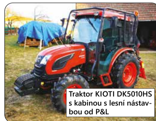
Traktor KIOTI DK5010HS s kabinou s lesní nástavbou od P&L