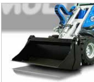
Kombinovaná lopata 4v1