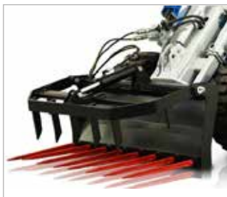
Vidle s drapákem