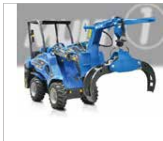
Drapák na dřevo