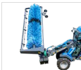
Čistič solárních panelů