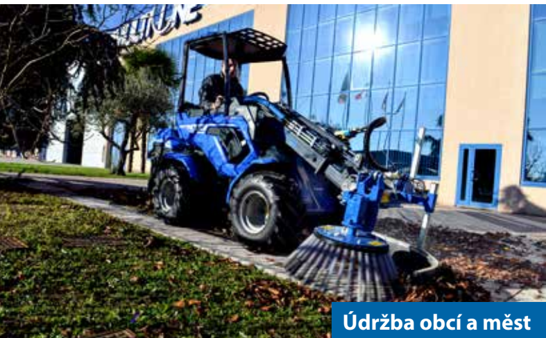
Údržba obcí a měst