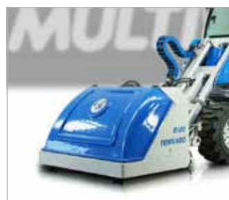
Rotační sekačka se sběrem