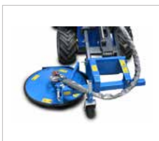
Obsékač stromů a kůlů