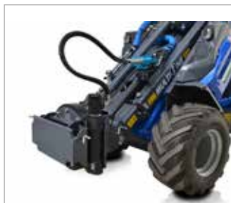
Natáčecí adaptér pro příslušenství