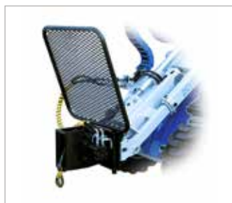
Naviják na stromy