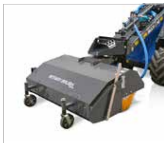
Kartáč se sběrem