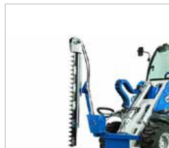
Nůžky na větve