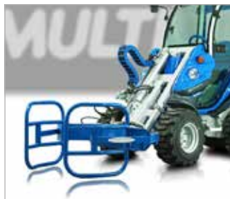
Kleště na kulaté balíky