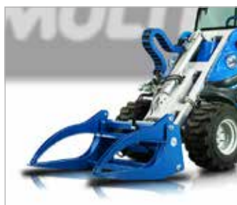
Kleště na kulatinu