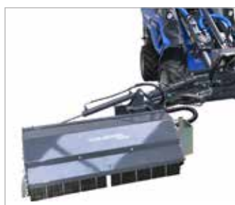
Mulčovač s bočním posunem