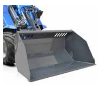
Brány pro koňské dráhy