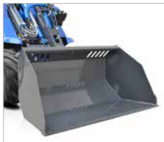
Lopata základní s průzory na břít