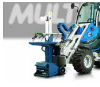
Štípač na dřevo