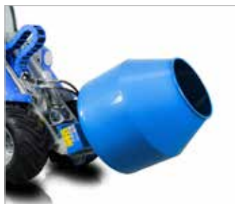
Míchačka na beton