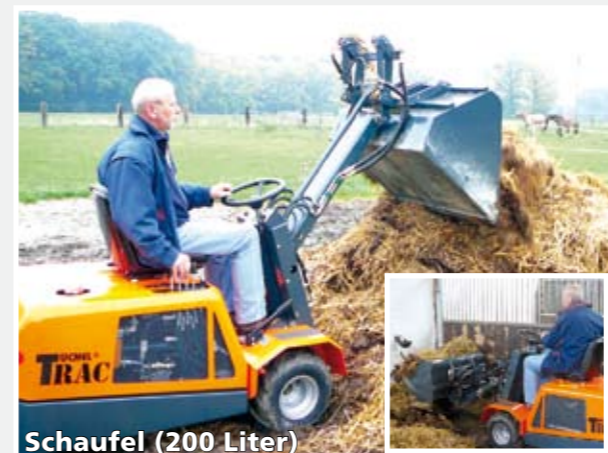
Schaufel (200 Liter)