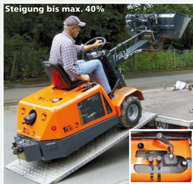
Steigung bis max. 40%