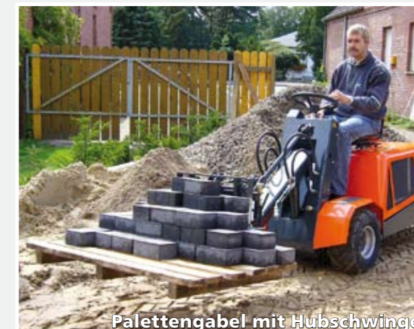
Palettengabel mit Hubschwinge