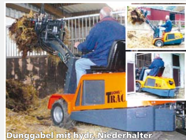
Dunggabel mit hydr. Niederhalter