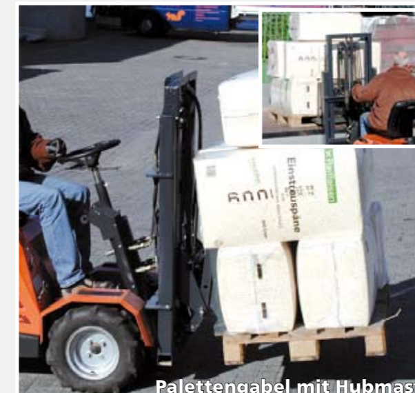
Palettengabel mit Hubmast