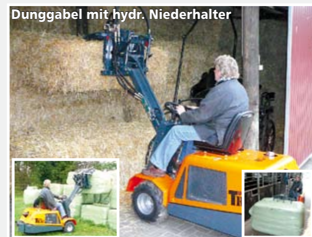
Dunggabel mit hydr. Niederhalter