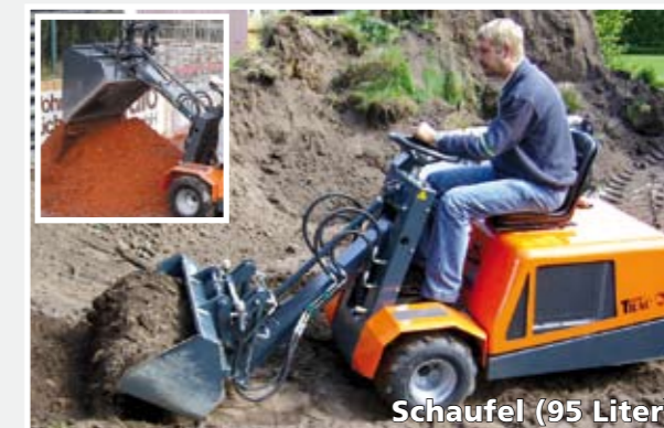
Schaufel (95 Liter)