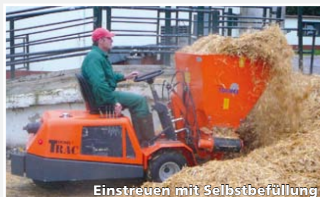
Einstreuen mit Selbstbefüllung